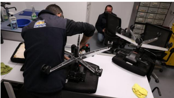
05 / 09