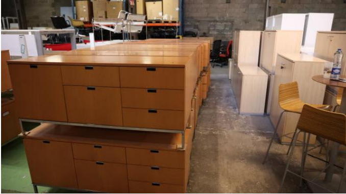
03 / 09