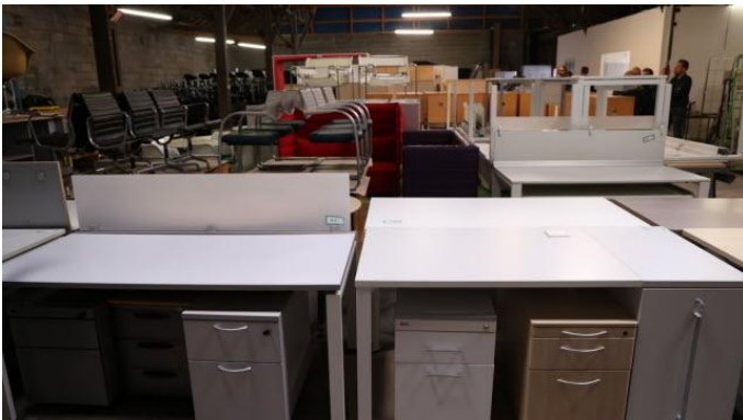
04 / 09